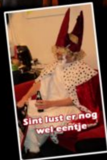
Sint lust er nog wel eentje