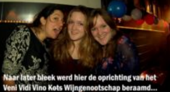
Naar later bleek werd hier de oprichting van het Veni Vidi Vino Kots Wijngenootschap beraamd...